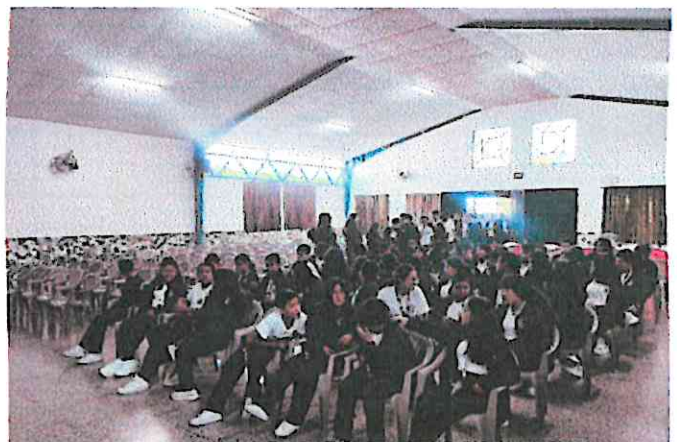
Ingreso de los alumnos del Centro Vocacional San José al auditorio del establecimiento 24/09/2024